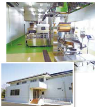
▲学校給食センター