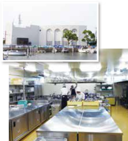
▲ウエディングパレス